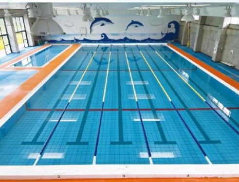
▶志布志運動公園屋内温水プール