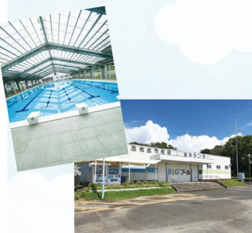
▶有明 B&G 海洋センタープール

やっちくふるさと村 （停留所 No.7074 やっちく道の駅）が隣接 しているので、美味しい スイーツを食べて帰るのも オススメですよ！