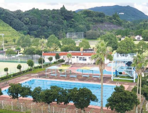
▶城山総合運動公園プール

場 所 志布志町安楽 201-1 電 話 ☎099-473-2851 営業時間 10:00～21:00 利用料金 市内在住者 大人 200円 / 小中学生 110円 / 幼児 50円 定休日 月曜（月曜が祝日のときは開館、翌日休み）